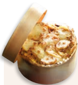
LE GRATIN TARTIFLETTE