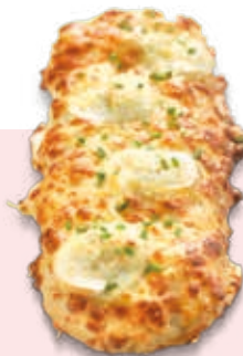
JAMBON & CHÈVRE