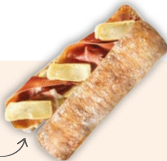
LE SERRANO & REBLOCHON AOP